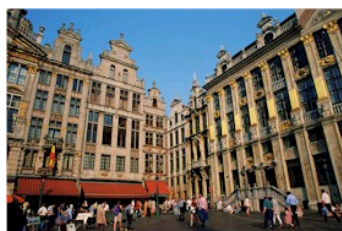
Barocke Zunfthäuser auf dem Großen Markt