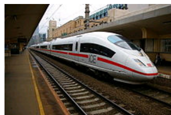
Der ICE hält am Brüsseler Nordbahnhof