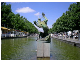
Brunnen auf dem ehemaligen Hafenbecken am Fischmarkt

In der Nähe des Hotels liegt der Fischmarkt. Dort befand sich im Mittelalter der Binnenhafen von Brüssel. Viele Gebäude aus dem 17. und 18. Jahrhundert erinnern daran. An den ehemaligen Kais gibt es heute eine Vielzahl von Restaurants, Touristen verirren sich in diese stillere Ecke Brüssels nur selten. Vom Hotel aus ist der Große Markt („Grand' Place“) mit barocken Zunfthäusern, in seiner Geschlossenheit einer der schönsten Plätze der Welt, ebenfalls in wenigen Minuten zu Fuß erreichbar.